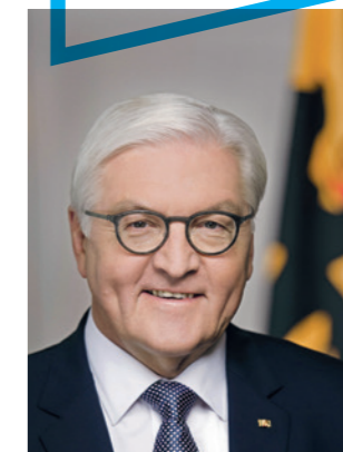
BUNDESPRÄSIDENT FRANK-WALTER STEINMEIER ist Schirmherr von Jugend debattiert.